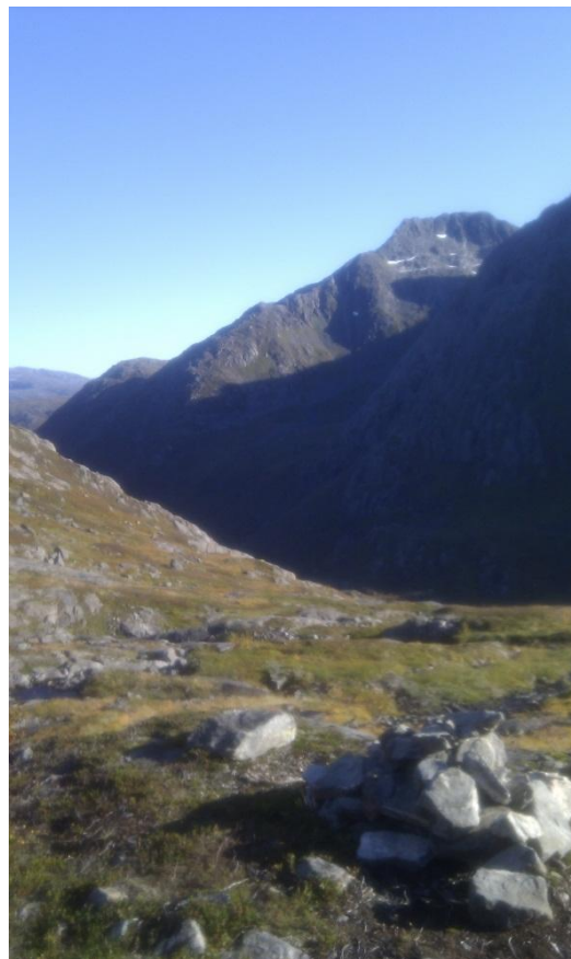
På vei opp fra Løbergsdalen.