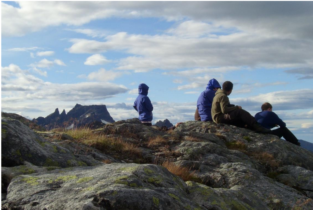
Med Møysalen i det fjerne